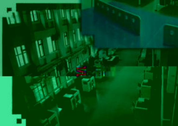
DMG 数控技术 训练场所